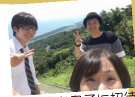
新潟に住む息子に招待され、長岡の花火大会へ！替で有名なお店で海鮮丼も食べました！

お客様の人生が今以上に豊かになるよう、保険だけが持つ価値を伝え続け、互いに共感し信頼できるお客様の輪をより大きく広げていきます。これは私の仕事におけるミッションです。この使命を胸に皆さまに価値ある保険の提案をします。皆様にとっての最善を考え伝えていきます。