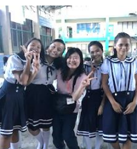
セブ島の貧困地域へ「幸せの価値観」や「受け入れる心」について、深く考える経験となりました。

★宅建士の資格を取得します！ 弊社には空き家相談士（長谷川）がおり、たすか〜る事業もあります。皆様の住まいに関するお悩み・お困りごとを様々な角度から解決して参ります。 ★いろいろな人・モノに出会い、たくさん感動します！ 感動＝〈ローマ字〉CAN DO＝君ならできる！になる。