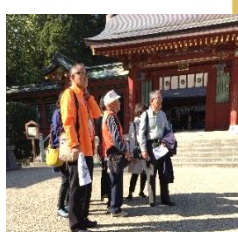
ハセプロ初企画！ 「大人の遠足 in 湯釜」

昨年も多くの方と出会い、いろんな仕事をさせていただきました。感謝！今年もまたたくさんのご依頼いただけるよう自分磨きをしていきます。これから増えてくる介護リフォームの事をもっと勉強して皆様に分かりやすくご提案できるようにします。もちろん、小さなお困り事もどこよりも早く対応を心がけます。そして昨年以上に「助かるよ」と言っていた回数を増やします。