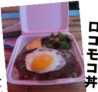
ハワイのロコモコ丼 やっぱり本場はおいしい！！でも日本人が作ってました(笑)

去年は、滋賀県、京都府、静岡県・・・と仲間たちと様々な場所へ旅行することができました。私は御朱印も集めているのですが、まだ行ったことのないところへ行ってその思い出をお客様や友人たちに伝えていきます。また、私の故郷である浪江町が徐々に復興へと歩んでおります。自分が何かできることを考え少しでも復興の手助けができるようにしていきます。