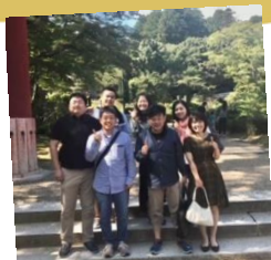
前職では事務所に独り。でも今は7人！ 「人がいるって良いな」♪

昨年は、物事を成し遂げるためには相当の時間がかかることを表す「桃三李四」を念頭に取り組みました。今年に入社3年目。仕事に慣れ、良い癖も悪い癖も付く時期だと言われます。確認を怠らず、良い実（結果）を生み出せるよう、学びの時間を積極的に増やしたいと思います。