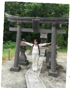
ハセプロ社員でウォーキング！

人生を全力で楽しみます！！ 今、こうして生きていることに感謝して、どんなに小さなことも大切にしていきたいです。家族での思い出もたくさん作ります！健康のために、毎日最低15分継続して、ウォーキングします継続は力なり！！長く続ける芯の強さを持ちたいです。