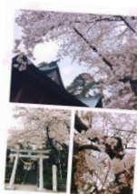
弊社近くの石森神社の桜 お花見をしながら読書をしました。『気』が良くて癒されました。