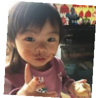
最愛の娘！2歳になり少しずつお話できるようになりました！

やりたいことにはどんどんチャレンジする一年にしたいです！自己啓発、家族旅行、運動、とにかく何もせず後悔はしたくないのでプライベートもおもいっきり楽しみます。今年の年末は思い出の写真があまりすぎて選びきれないくらいになっていると思います。いい仕事をするにはプライベートも充実してないといけません。社長すみません、有給休暇が足りないかも。